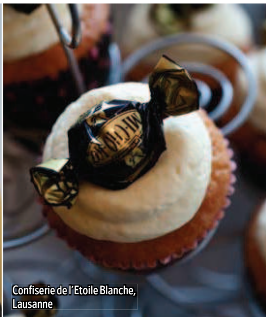
Confiserie de l'Etoile Blanche, Lausanne