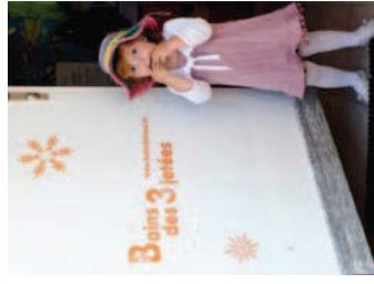
BAINS DES 3 LETTRES Le comme hiver, les Bains reçoivent une clientèle en quête d'air lacustre à Nyon. L'endroit compte également une salle de repos avec poêle à bois, une salle de massage et un sauna.

Au fond d'une impasse piétonne, ce centre lumineux cartonne avec ses cours en français ou en anglais. Trois professeurs proposent Kundalini yoga, personal training, Pilates pour maman, kids yoga, danse pour adultes et danse expressive pour enfants. Les familles bobos et les expats adorent!