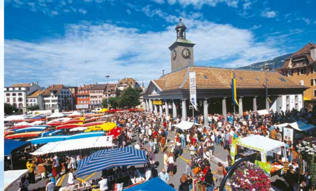
S. Engler / Montreux-Vevey Tourisme

Cortèses, en dessous de Chexbres, ces 3 000 mètres carrés dédiés à l'étude de ce cépage et de dix-neuf de ses variétés sont ouverts à la visite (libre). Première vendange cette année. Un sentier balisé permet de rejoindre ensuite deux villages accrochés aux premières pentes du mont Pèlerin. D'abord Saint-Saphorin, superbe avec ses ruelles étroites et son église gothique, puis Rivaz, la plus petite commune de Lavaux avec 32 hectares, dont 20 viticoles. Entre les deux, le château de Glérolles, longtemps limite orientale de l'évêché de Lausanne. À l'abri des regards, sa terrasse sur le lac est idéale pour une dégustation hors du temps. Retour sur Lutry en train CFF en dix minutes (un arrêt par heure à Rivaz jusqu'à 0 h 54).